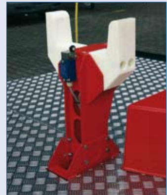
Sichere Ablage für Teleskoparm