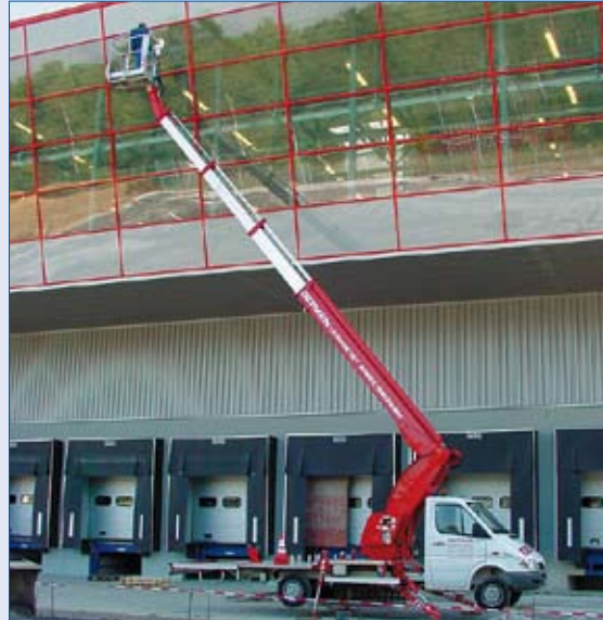
Flexibler Einsatz - Gebäudereinigung