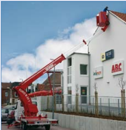
EURO B 20 T - Einsatz an einer Hausfassade