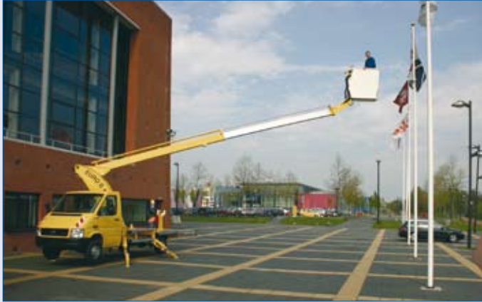
EURO B 16 T - große seitliche Reichweite

...arbeiten in Höhen von 16 bis 25 Meter.