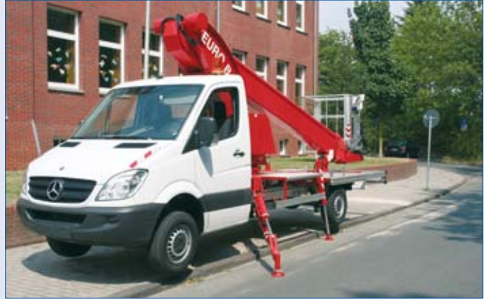
Schmale Abstützung innerhalb der Fahrzeugkontur - keine Verkehrsbehinderung