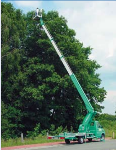
EURO B 25 T - Baumpflege