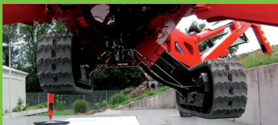
Aj nová LEO 23 GT má patentovaný systém výškovo a na šírku nastaviteľného pásového podvozku