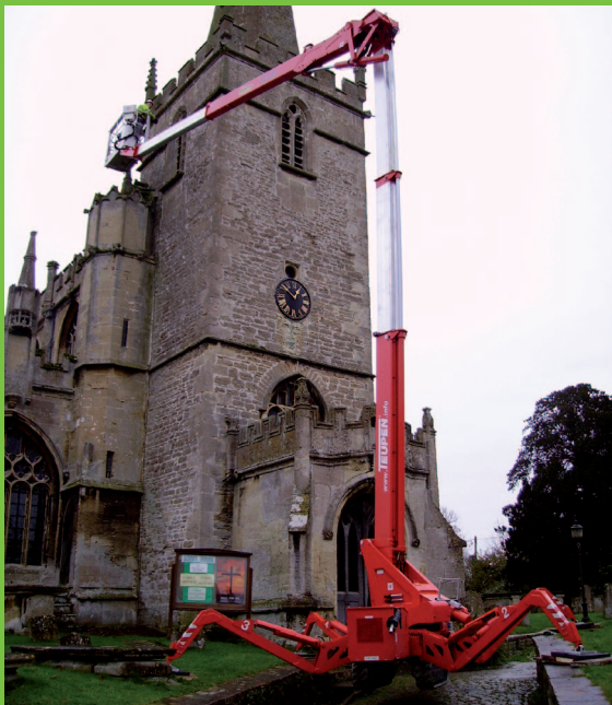
Veľký bočný dosah a variabilné podpery (široké alebo úzke podopretie plošiny) – ideálna kombinácia