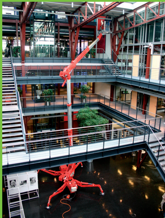
Flexibilná a bezpečná práca aj na ťažko prístupných miestach vnútorných priestorov