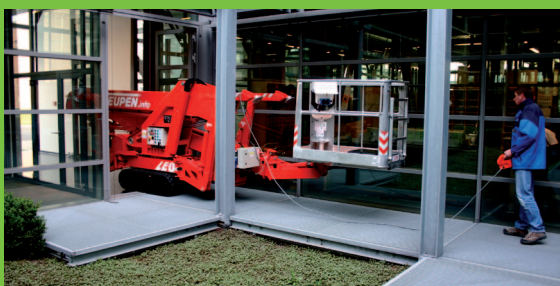
Bezpečný prejazd na miesto nasadenia pri použití vo vnútorných priestoroch