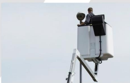
Kôš pre 2 osoby