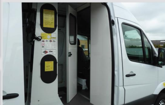
Priamy prístup z kabíny do koša (voliteľná výbava)