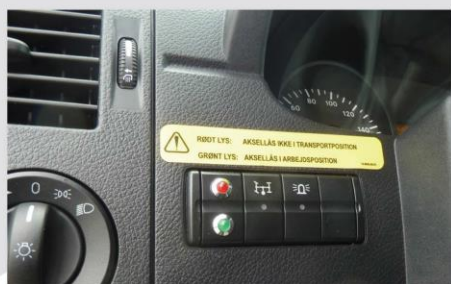
Ovládací panel v kabíne