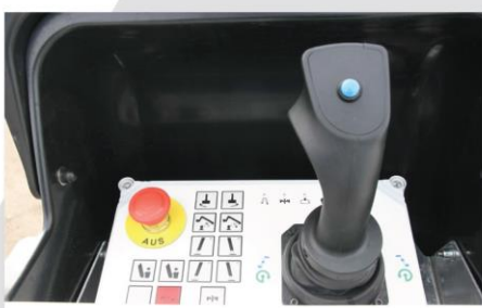
Proporcionálne ovládanie (1 joystick)