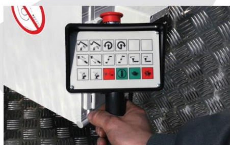
Spodné káblové ovládanie