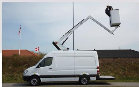
Zábleskové svetlá na stĺpe plošiny