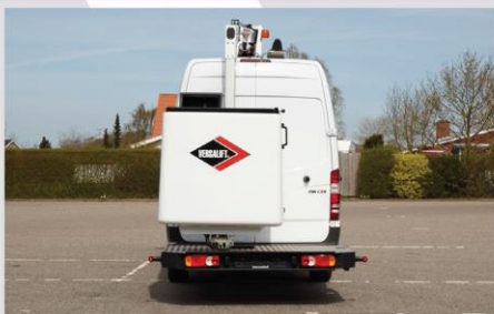
Zadná nástupná plošina (asymetricky uložený kôš)