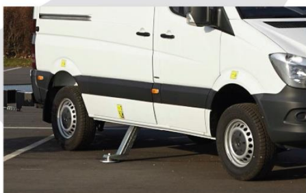
Podpery typ "A"