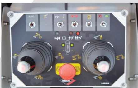
IPC: Ovládanie 2 joystickmi