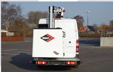
Zadná nástupná plošina (asymetricky uložený kôš)