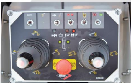
IPC: Ovládanie 2 joystickmi