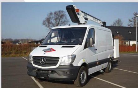
Zábleskové svetlá na stípe