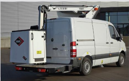
Hliníková nástupná plošina