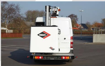
Zadná nástupná plošina (asymetricky uložený kôš)