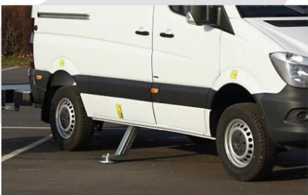
Podpery typ "A"