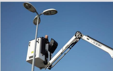
90° Rameno koša