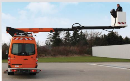
Pri otáčaní nepresahuje obrys spätných zrkadiel