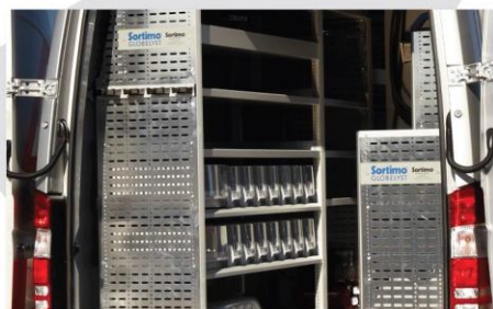
Vnútorne dielenské vybavenie (voliteľná výbava)