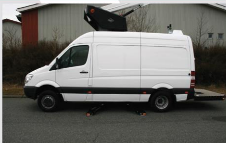
Zadná nástupná plošina **