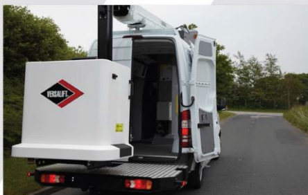
Zadná nástupná plošina (asymetricky umiestnený kôš)