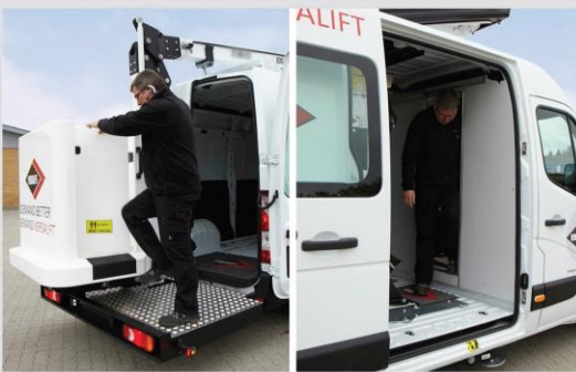
Priamy nástup z kabíny do koša (voliteľná výbava)