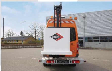
Zadná nástupná plošina (asymetricky umiestnený kôš)