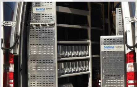
Vnútroň dielenské vybavenie (voliteľná výbava)