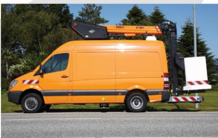
Zábleskové svetlá na stĺpe