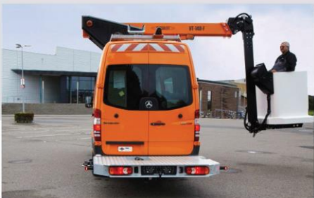
Pri otáčaní nepresahuje obrys spätných zrkadiel